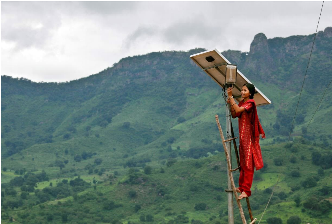
Eine Ingenieurin für Solarenergie im Solar-Dorf Tinginaput, Indien.

Die Vorteile von Klimaschutzmaßnahmen sind vielfältig und sprechen verschiedene Interessen vom Umweltschutz über die Verbesserung der Lebensbedingungen, der Förderung von Energiesicherheit und die Schaffung von Arbeitsplätzen an (IASS 2017). In den folgenden Unterkapiteln wird eine Theorie zu menschlichen Werten vorgestellt, die dabei helfen kann zu verstehen, was verschiedene Menschen zum Handeln motiviert. Außerdem werden relevante Erfahrungen aus der Forschung zum Co-Benefits-Framing zusammengefasst und ein Weg vorgeschlagen, mögliche negative Effekte des Opportunity Framings zu vermeiden.