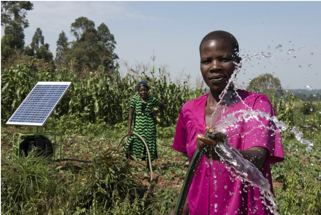
Pflanzenbewässerung mit einer solarbetriebenen Wasserpumpe außerhalb von Kitale, Kenya.

Die Zusammenarbeit mit Partnern außerhalb des Umweltsektors wie Geschäftsorganisationen, Experten und Influencer kann ebenfalls helfen, eine Botschaft zu verbreiten und die Diskussion zu beleben. Zusätzlich können neue Partnerschaften für die Öffentlichkeitsarbeit einen wichtigen Teil bei der Einbeziehung von Frauen, jungen Menschen und anderen ausgegrenzten Gruppen spielen und deren Stimmen hörbar werden lassen (Dupar, McNamara und Pacha 2019), wodurch authentische Vorbilder mit Identifikationspotenzial für unterschiedliche Zielgruppen ausgebildet und gefördert werden.