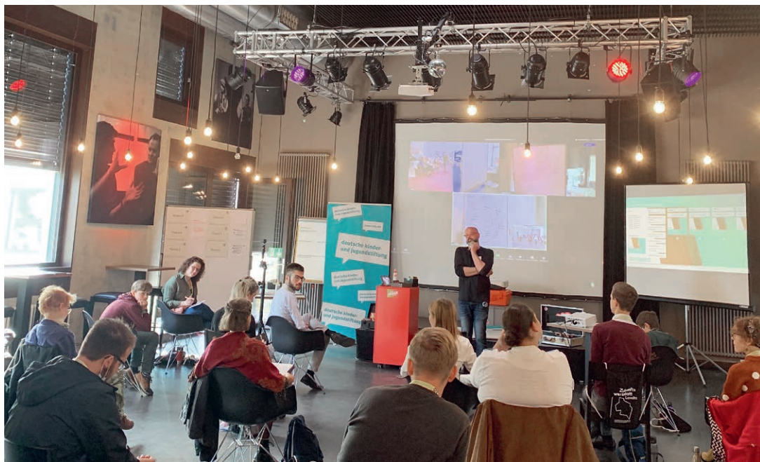
Jugendkonferenz #MISSION2038: Deine Ideen für die Lausitz am 19. September 2020 in der Kufa Hoyerswerda