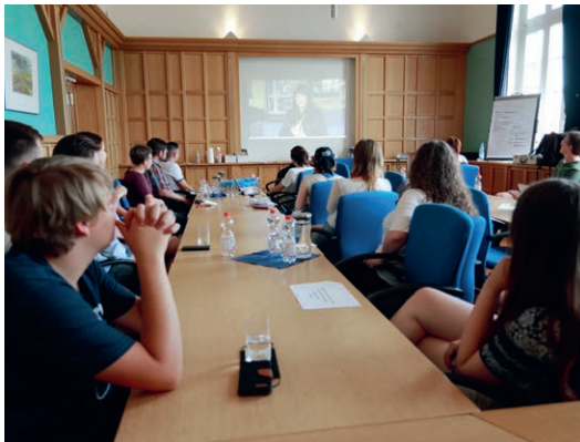
Arbeitstreffen mit den Projekten der #MISSION2038 im Ratssaal des Rathauses Weißwasser am 21.06.2021

Das Modell-Projekt #MISSION2038 (S. Kasten S. 9) bezieht Kinder und Jugendliche im Rahmen von Jugendhearings und Jugendkonferenzen direkt in den Strukturwandel vor Ort mit ein. Dieses Format sollte in eine zeitliche Kontinuität und regionale Verbindlichkeit gebracht werden.