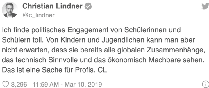
Abbildung 6.2: Tweet des FDP-Vorsitzenden Christian Lindner am 10. März 2019

https://twitter.com/c_lindner/status/1104683096107114497