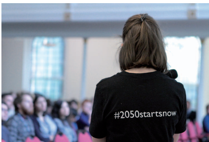
Eine junge Freiwillige leitet in Schottland eine Sitzung mit über 100 jungen Menschen, auf der gemeinsam eine CO 2 -arme Zukunftsvision entworfen wird.

Statt Pressemitteilungen und Podiumsdiskussionen brauchen wir eine Debatte über Teilhabe und Einbindung und müssen dabei Ungerechtigkeiten offen ansprechen. Wir müssen Fragen stellen wie: Was bedeutet es, das Wohlergehen der zukünftigen Generationen zu berücksichtigen? Wie leiten wir die notwendige Veränderung der Werte, Prozesse und Ziele unserer politischen, wirtschaftlichen und sozialen Systeme ein? Welche Arten von Prozessen sind zielführend und funktionieren für uns?