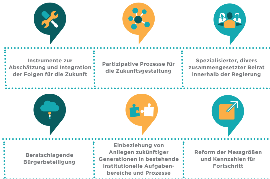
Abbildung 1: Überblick über die sechs im Zukunftsinstrumentarium beschriebenen Prozesse für eine gerechte Zukunftsgestaltung.

Lange haben wir eine kognitive Distanz zwischen uns und der Realität des Klimawandels aufrechterhalten, den wir als in der Zukunft liegendes Problem ansahen. Doch jetzt übernehmen im Kontext der Klimakrise die jungen Leute die Hauptrolle, und viele Menschen können sich relativ einfach mit diesen Protagonisten identifizieren. 2 Überall auf der Welt haben junge Menschen die unmittelbare Gefahr durch den Klimawandel für ihr Leben begriffen. Sie bringen das Thema in die Gegenwart und stellen Fragen, die auf die zentrale Funktionsweise unserer sozialen, wirtschaftlichen und politischen Systeme abzielen. Um auf ihre Forderungen zu reagieren, müssen wir uns ernsthaft mit der Zukunft – mit ihrer Zukunft – befassen, und zwar auf eine für uns bislang ungewohnte Art und Weise.