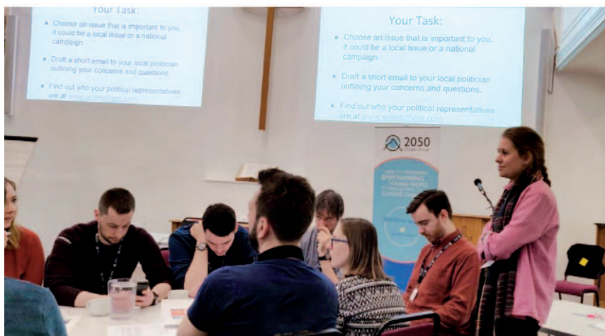
Ein Workshop der 2050 Climate Group mit dem Ziel, jungen Menschen die Teilhabe an politischen Prozessen rund um den Klimawandel zu ermöglichen

Prozesse zur Beteiligung beratender Bürger/-innen (in der Größenordnung von themenorientierten Mini-Ausschüssen bzw. „Mini-Publics“ bis hin zu landesweiten Bürgerversammlungen) können Konsensbildung und längerfristiges Denken ebenfalls erleichtern. Die Ergebnisse, Entscheidungen oder Ideen, die aus solchen Prozessen hervorgehen, können mit konkreten Empfehlungen, verbindlichen Vorschlägen für die Regierung oder anderen für den Kontext relevanten Ergebnissen zur Entscheidungsfindung beitragen. Gegenstand können spezifische Fragen oder Themen oder auch eine allgemeinere Vision der Zukunft sein. Außerdem ist die genaue Abbildung der demografischen Gegebenheiten (einschließlich junger Menschen und zukünftiger Generationen) ein wesentlicher Faktor für den Erfolg und die Legitimität derartiger Prozesse. and future generations, is crucial to the success and legitimacy of such processes.