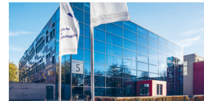
Das Bürogebäude in der Helmholtzstraße 5.

Das IASS erschließt „alle Quellen unseres Erfindungsreichtums“, wie es im Potsdam-Memorandum heißt. Es führt viele unterschiedliche Formen des Wissens zusammen und setzt bewusst auf einen neuen Vertrag zwischen Wissenschaft und Gesellschaft.