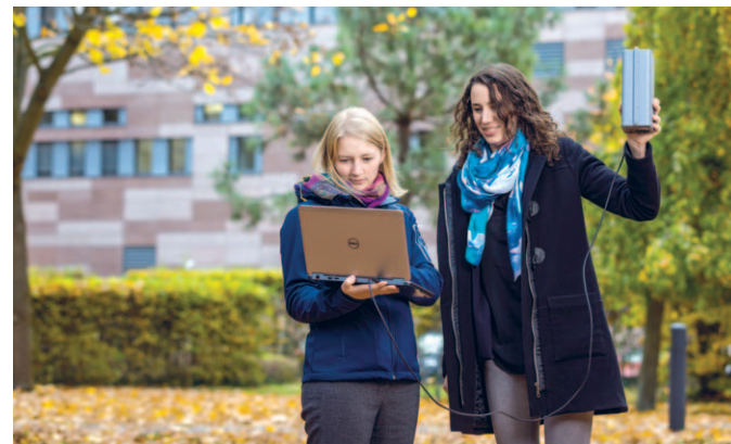
Luftqualität ist ein Forschungsschwerpunkt am IASS.