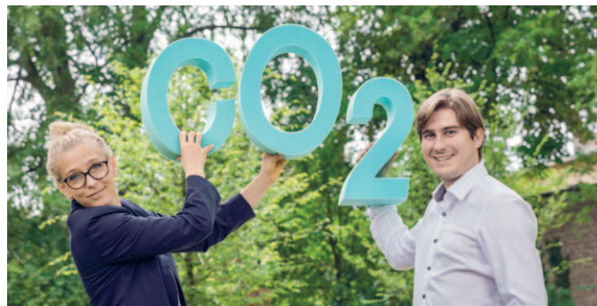
Ist CO 2 -Recycling eine Option für die Gesellschaft?

Das IASS forscht mit dem Ziel, Transformationen in Richtung Nachhaltigkeit aufzuzeigen und zu unterstützen – in Deutschland, Europa und global. Was sind Bedingungen für gelingende Nachhaltigkeitstransformationen? Wie können und wie sollten Transformationsprozesse gestaltet werden? Diese Fragen bearbeitet das IASS an ausgewählten Feldern der Nachhaltigkeit.